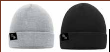
TeenStreet 2021 beanie 12.99€

Use coupon code IAMNAMED21 at checkout online.