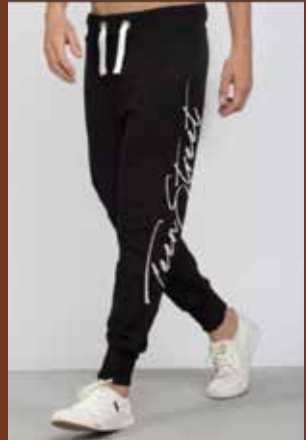
TeenStreet 2021 sweatpants unisex 39.99€