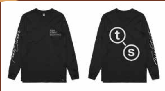
TeenStreet 2021 long sleeve unisex shirt 26.99€